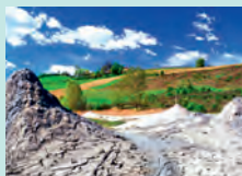
Fiorano Modenese, Salse di Nirano