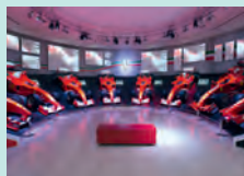
Maranello, Museo Ferrari