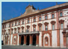
Sassuolo, Palazzo Ducale