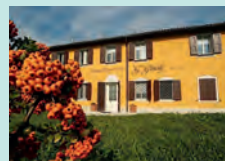
Modena, Acetaia Giusti

Il Centro Riacef è aperto dal lunedì al venerdì dalle ore 6.00 alle 21.30 , il sabato dalle 6.00 alle 13.30 . Nel periodo estivo non si effettua chiusura. Per prenotazione telefonica dal lunedì al venerdì dalle ore 7.00 alle 21.30 , il sabato dalle 7.00 alle 13.00 .