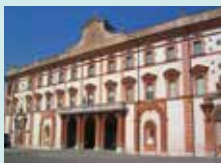
Sassuolo, Palazzo Ducale