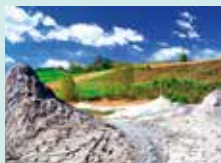
Fiorano Modenese, Salse di Nirano