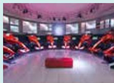
Maranello, Museo Ferrari