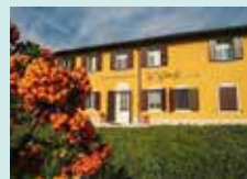
Modena, Acetaia Giusti

Il Centro Riacef è aperto dal lunedì al venerdì dalle ore 6.00 alle 21.30 , il sabato dalle 6.00 alle 13.30 . Nel periodo estivo non si effettua chiusura. Per prenotazione telefonica dal lunedì al venerdì dalle ore 7.00 alle 21.30 , il sabato dalle 7.00 alle 13.00 .